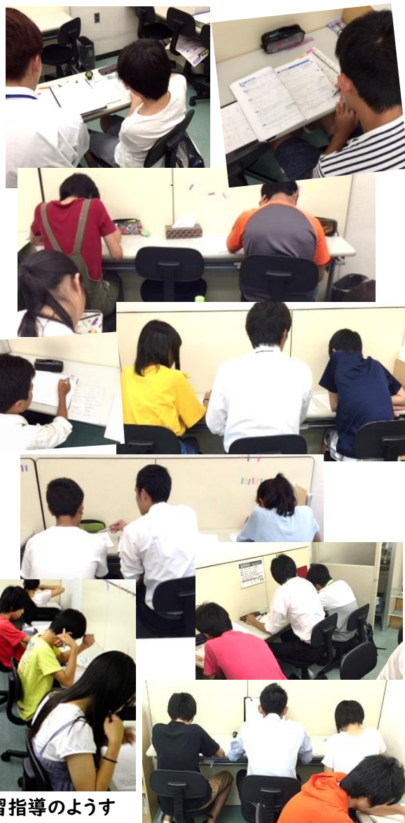
これまでの桂カレッジ夏期講習指導のようす

もし冬にコロナ休校があれば、受験生は致命的。 先のことも考え、やれる今にたっぷり対策しておくべき。